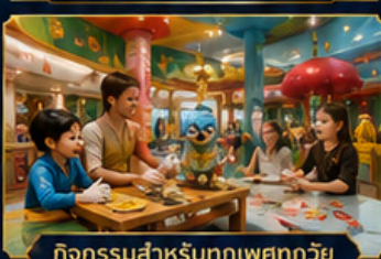
กิจกรรมสำหรับทุกเพศทุกวัย