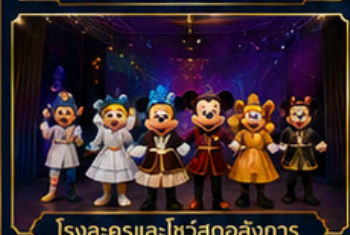
โรงละครและโชว์สุดอลังการ