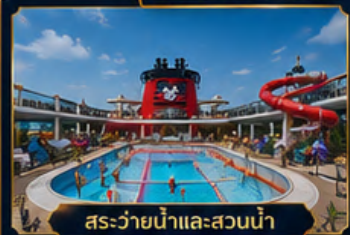
สระว่ายน้ำและสวนน้ำ