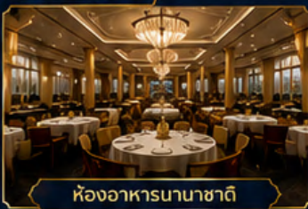
ห้องอาหารนานาชาติ