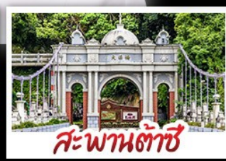
สะพานต้าซี