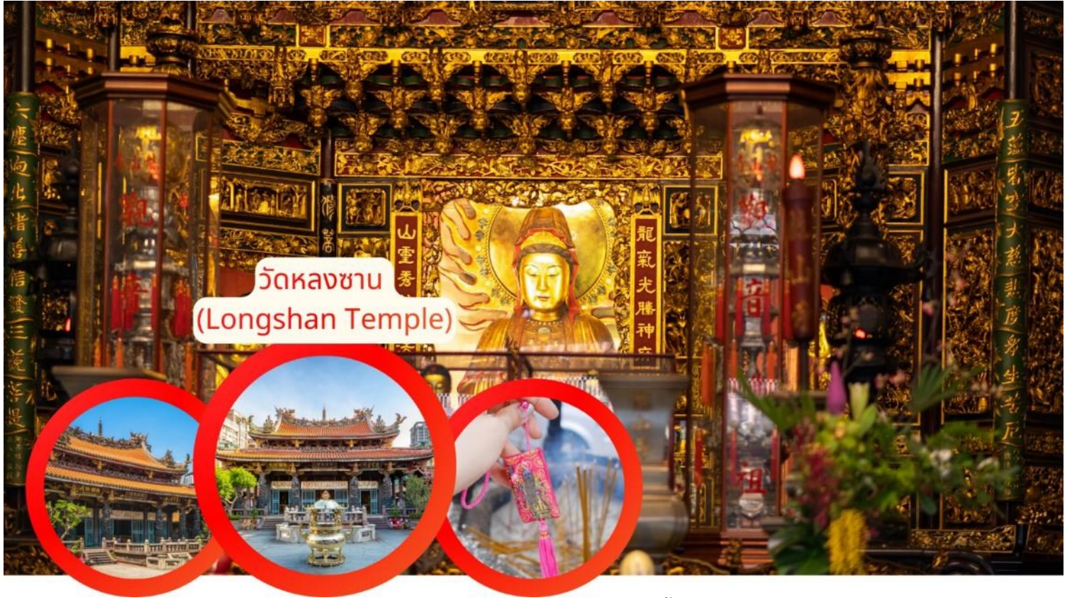
วัดหลงซาน (Longshan Temple)

กลางวัน รับประทานอาหารกลางวัน Xiao Long Bao (เสี่ยวหลงเปา) (มื้อที่ 8)