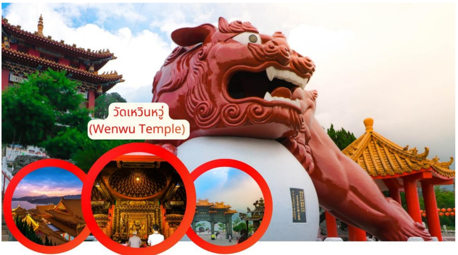
วัดเหวินหวู่ (Wenwu Temple)

เคล็ดลับเสริมดวง: การนำกระดิ่งทองคำ ตามปีนักษัตร เขียนคำอธิษฐานแล้วนำไปแขวนไว้ตามวันเกิดของตัวเองที่บันได 366 ขั้น เชื่อว่าจะทำให้เสียงกระดิ่งส่งคำขอถึงสรวงสวรรค์