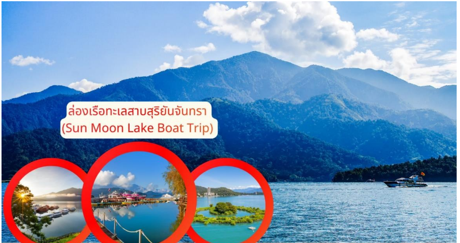
ล่องเรือทะเลสาบสุริยันจันทรา (Sun Moon Lake Boat Trip)

จากนั้นนำท่านเดินทางสู่ วัดเสวียนกวง หรือ วัดพระถังซัมจั๋ง (Xuanguang Temple) ริมทะเลสาบสุริยันจันทรา สัมผัสความงดงามของ วิวทะเลสาบสุริยันจันทรา พร้อมสักการะเพื่อ เสริมสิริมงคลด้านการเรียนและการทำงาน ที่วัดพระถังซัมจั๋ง สถานที่ศักดิ์สิทธิ์และเต็มไปด้วย สถาปัตยกรรมจีนดั้งเดิม และประติมากรรมที่สื่อถึงตำนานพระถังซัมจั๋ง เพลิดเพลินกับบรรยากาศสงบ ริมทะเลสาบ เหมาะกับการถ่ายภาพและพักผ่อนจิตใจ