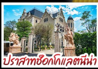
ปราสาทช็อกโกแลตนี้่น่า