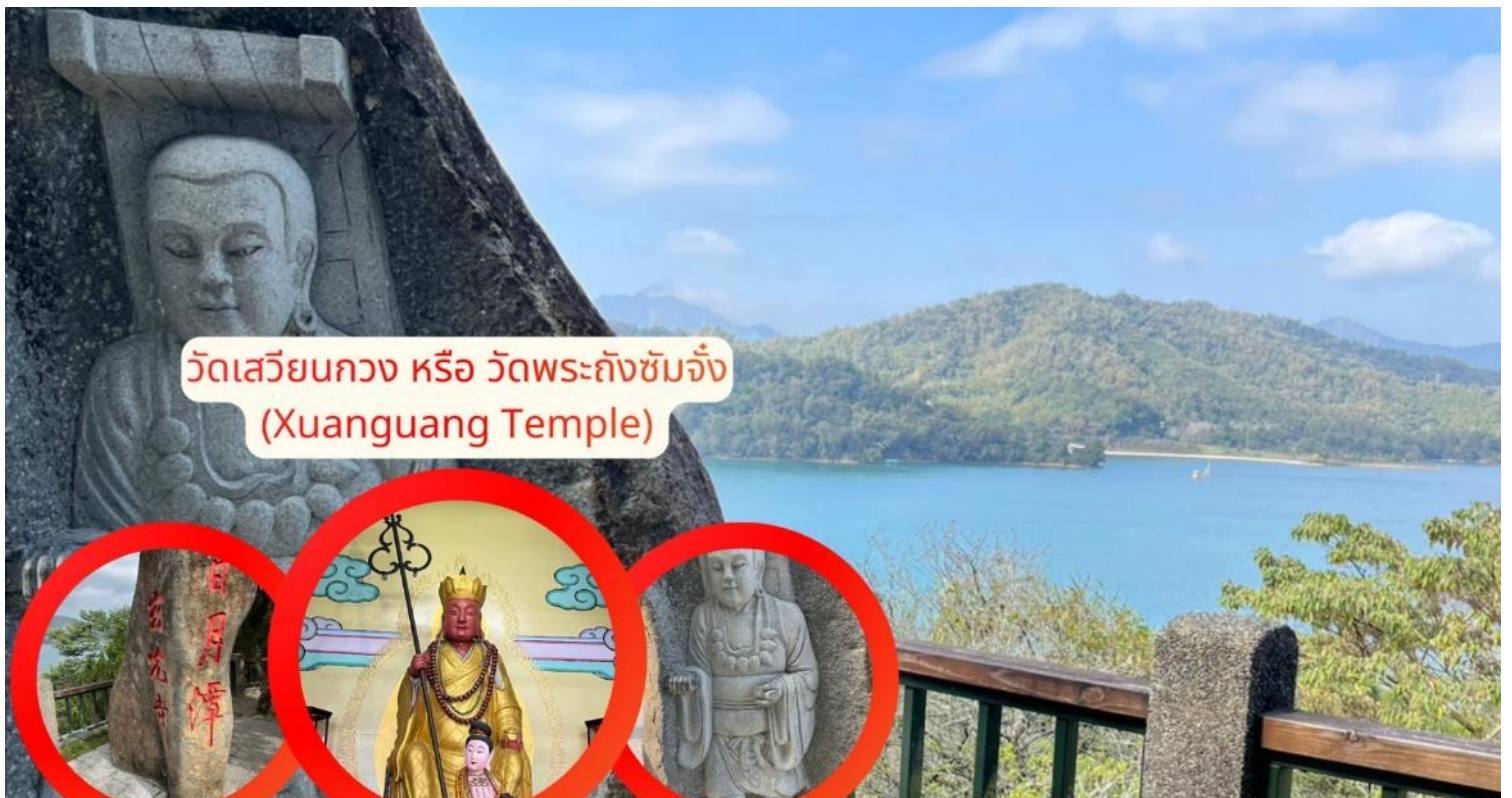
วัดเสวียนกวง หรือ วัดพระถังซัมจั๋ง (Xuanguang Temple)

จากนั้นนำท่านเดินทางสู่ วัดเสวียนกวง หรือ วัดพระถังซัมจั๋ง (Xuanguang Temple) ริมทะเลสาบสุริยันจันทรา สัมผัสความงดงามของ วิวทะเลสาบสุริยันจันทรา พร้อมสักการะเพื่อ เสริมสิริมงคลด้านการเรียนและการทำงาน ที่วัดพระถังซัมจั๋ง สถานที่ศักดิ์สิทธิ์และเต็มไปด้วย สถาปัตยกรรมจีนดั้งเดิม และประติมากรรมที่สื่อถึงตำนานพระถังซัมจั๋ง เพลิดเพลินกับบรรยากาศสงบ ริมทะเลสาบ เหมาะกับการถ่ายภาพและพักผ่อนจิตใจ