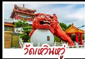
วัดเขวินเซวี่

อาลีซาน - ทะเลสาบสุริยันจันทรา - ไทเป101 วัดหัวหน่วง - อนุสรณ์สถานเจียง ไคเชก วัดหลงซาน - ตลาดกลางคืนซีเหมินติง เมนู หมูหนึ่งจิวรสซี่ - เขียวหลงเปา - ชาบูไต้หวัน