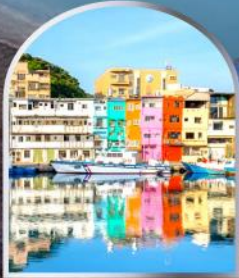
หมู่บ้านประมงหลากี้