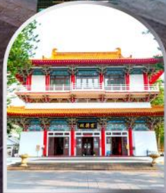
วัดพระถัมจิ๋ว