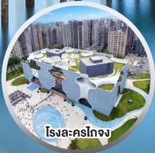
ไถจง-นครไทจง