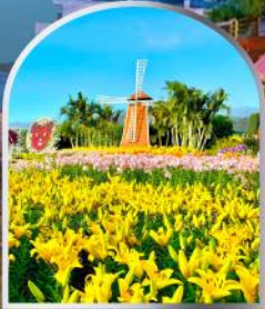
สวนดอกไม้จงเซอ