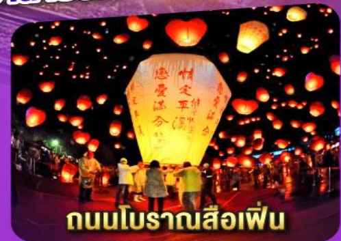
ถนนโบราณสี่กั๊ก