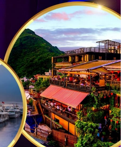
หมู่บ้านโบราณจิวเฟิน