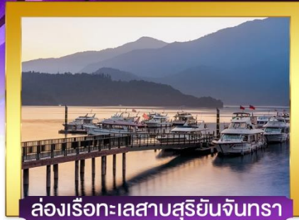
ล่องเรือทะเลสาบสุริยันจันทรา