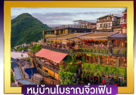
หมู่บ้านโบราณจิวเฟิน

อิมพอร์ตกับ Michelin Star เสี่ยวหลงเปา ปลาประจานาธิบดี