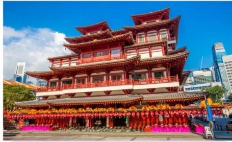
วัดพระเขี้ยวแก้ว