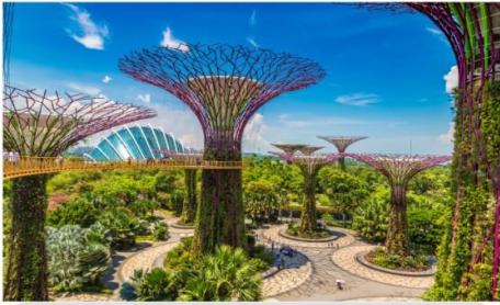
การ์เด้นบายเดอะเบย์