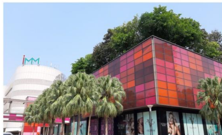
IMM เอาร์ทรีต