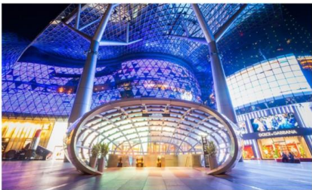
ชอปปีงออร์ชาร์ด