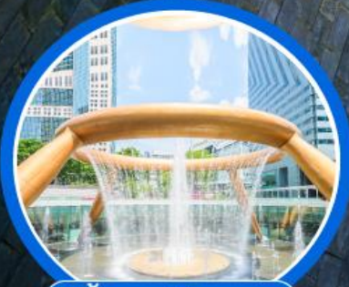
น้ำพุแห่งโซคลาก