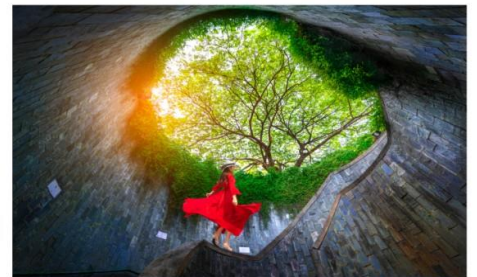
อุโมงค์ต้นไม้