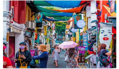
ตรอกฮาจิ