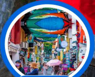
ตรอกฮาจิ