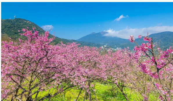
อุทยานแห่งชาติหยางหมิงซาน

PRO PREMIUM BOOKING CENTER WE MAKES GOOD TOUR HAPPEN.