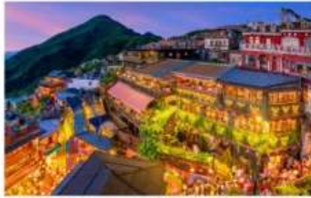
หมู่บ้านโบราณจิว่เฟิ่น