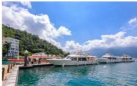
ล่องเรือทะเลสามสุริยันจันทรา