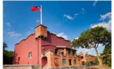
ปราสาทซานโตมินโก