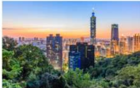
ซอปปิงตึกไทเป101