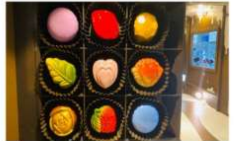
ปราสาทช็อกโกแลต