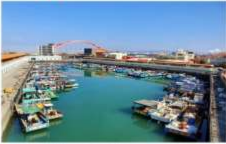
ท่าเรือประมงจู๋เว่ย