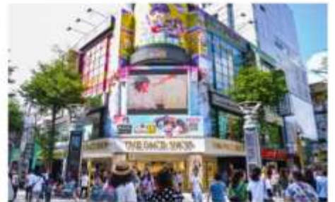
ซอปปิงซีเหมินตง