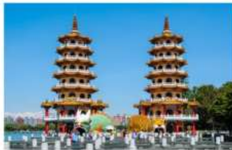
เจดีย์เสือเจดีย์มังกร