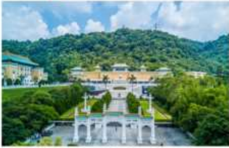
เข้าชมพระราชวังต้องห้ามกุ๊กกง