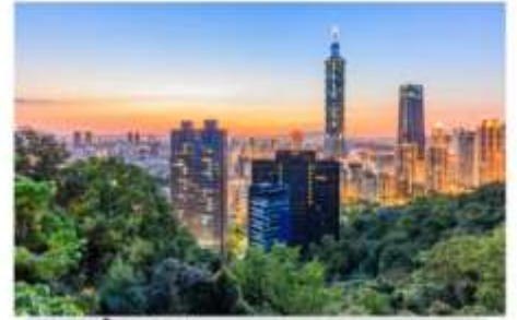
ช้อปปิ้งตึกไทเป101