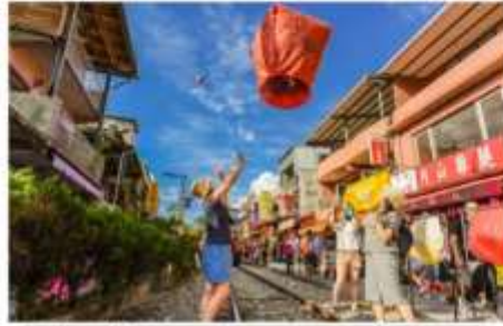
ปล่อยโคมลอยบนรางรถไฟ