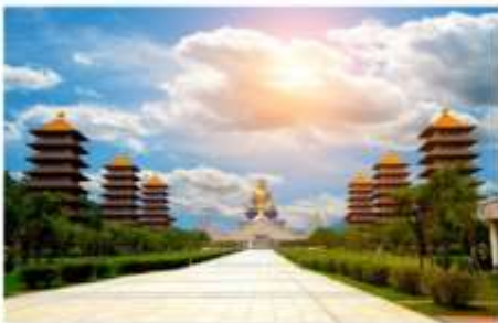
วัดไฟทวงชาน