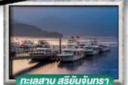
ทะเลสาบ สุริยันจินทรา

พิเศษ!! เมนูหนึ่งจักรพรรดิ Steamer Feast