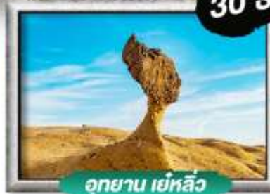
อุทยาน เย่หลิว