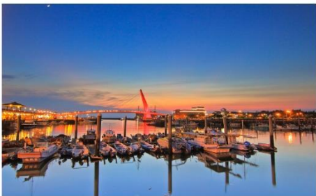
ท่าเรือชาวประมง ชมพระอาทิตย์ตก