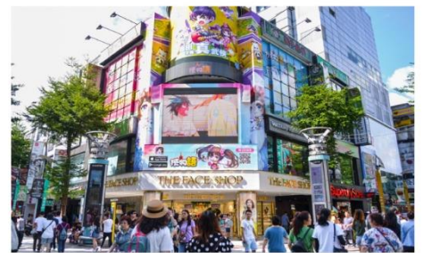
ช้อปปิ้งซีเหมินติง