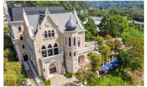
ปราสาทซ็อกโกแลต