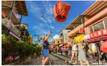
หมู่บ้านโบราณฉือเฟิ่น