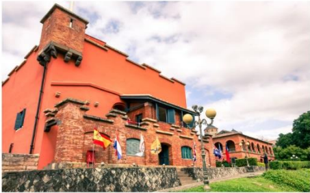
ป้อมปราการซานโตมินโก