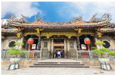
วัดหลงชาน