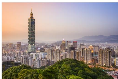
ช้อปปิ้งตึกไทเป101