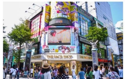
ช้อปปิ้งซีเหมินติง