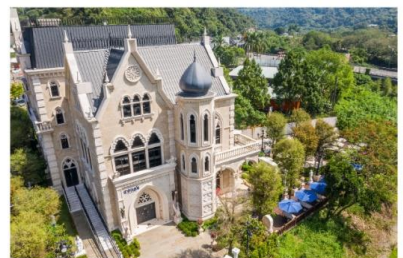
ปราสาทช็อคโกแลต