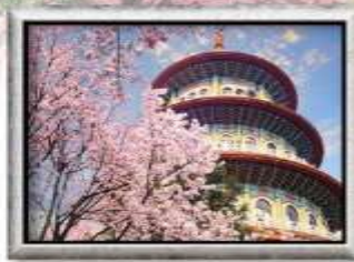
วัดอูจี เกียนหยวน