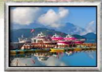
ทะเลสาบสุริยัมจินตรา