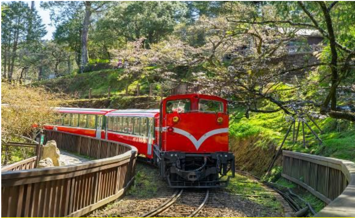
ไม่พลาดไฮไลท์ นั่งรถไฟโบราณอาลีซาน ชมป่าสนพันปี

นำคณะเดินทางสู่ อุทยานแห่งชาติอาลีซาน ซึ่งเป็นอุทยานที่มีความสวยงาม และมีชื่อเสียงที่สุดของไต้หวัน อาลีซานเป็นที่ตัดต้นไม้สนไซเปรส ล้วนแต่เป็นต้นที่มีขนาดใหญ่และใช้เวลาปลูกนาน หลังจากนั้นรัฐบาลไต้หวันจึงประกาศให้อาลีซานเป็นเขตป่าสงวนมาตั้งแต่ปี ค.ศ.2001 และกลายเป็นสถานที่ท่องเที่ยวสำคัญของเกาะไต้หวัน ด้วยความสูงของเขอาลีซาน กว่า 2,663 เมตร ทำให้ต้องเตรียมตัวเป็นพิเศษในเรื่องสภาพอากาศ เพราะอุณหภูมิจะต่ำกว่าปกติ **สำหรับท่านที่เมารถ แนะนำให้ทานยาแก้เมาในช่วงก่อนขึ้นอุทยานอาลีซาน** เดินเที่ยวชมป่าสนพันปี เป็นเส้นทางที่ไม่ไกลมากนัก แต่ต้องทำให้ทุกท่านร้องว้าวตลอดทาง เพราะต้นสนแต่ละต้นมีอายุร่วมพันปี สูงลิ่วขึ้นสู่ท้องฟ้า และไม่ใช่มีเพียงต้นสองต้นเท่านั้นที่นี้เป็นป่ารวมต้นสนไว้ในที่เดียว จึงไม่แปลกที่อาลีซานจะได้รับการอนุรักษ์ให้เป็นเขตป่าสงวนแห่งชาติของไต้หวัน