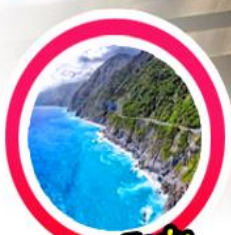
หน้าผาชิงสุ่ย