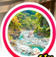
อุทยานทาโรโกะ