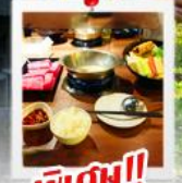
พิเศษ!! เช็กเมนูชาบูได้ทุกวัน

อุทยานแห่งชาติทาโรโกะ; พิพิธภัณฑ์สินอ่อน, ตลาดตงต้าเหมิน, หน้าผาชิงสุ่ย, อนุสรณ์เจียงไคเช็ค, ตึกไทเป 101 ตลาดหนิงเซี่ย, นั่งรถไฟโบราณ ชมป่าสนพันปีอาลีซาน, ตลาดหวินฮัว, หมู่บ้านโบราณจิวเฟิน, ตลาดซีเหมินติง