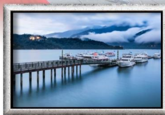
ทะเลสาบสุริยจีนตรา

✔ อิ่มอร่อยกับ!! สติ๊กสไลด์บาร์ หม้อนึ่งจักรพรรดิ