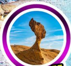
หินเคียวราชิโม