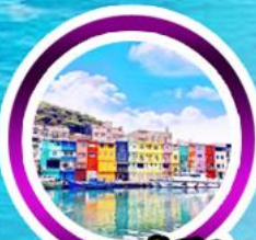
ท่าเรือเจิ้งปิ่น