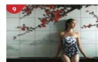
Crystal Life™ Spa Rejuvenate mind, body and soul with our holistic Western and Asian spa experience.