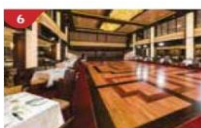
Dream Dining Room Savour a wide variety of Asian and international cuisine.