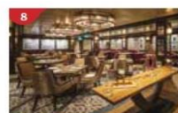
Bistro By Mark Best Relish contemporary Western cuisine from the internationally-acclaimed Australian chef.