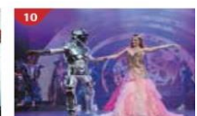
Zodiac Theatre Enjoy live production shows from the acclaimed award-winning entertainment team.