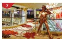
Johnnie Walker House™ Immerse yourself in the intricate world of premium Scotch whisky.