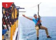
Ropes Course & Zipline Feel the thrill of gliding above the ocean on a 35-metre zipline.