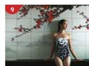
Crystal Life™ Spa Rejuvenate mind, body and soul with our holistic Western and Asian spa experience.