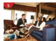
The Palace Indulge in European-style butler service and exclusive facilities.