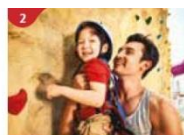
Rock Climbing Wall Challenge yourself on our mountainous rock climbing wall.