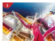
Waterslide Park Get drenched in fun on one of our six different waterslides.