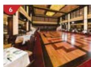
Dream Dining Room Savour a wide variety of Asian and international cuisine.