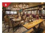
Bistro By Mark Best Relish contemporary Western cuisine from the internationally-acclaimed Australian chef.