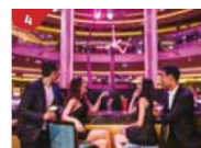
Bar 360 Catch live music and aerial acrobatic performances with a glass of champagne.