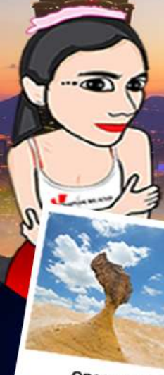
อุทยานเหยี่ยว