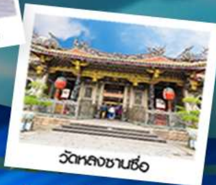
วัดหลงซานซื่อ

ธ.ค. 62 : 11 - 15 / 18 - 22 / 24 - 28 28ธ.ค. - 01ม.ค. 63 / 29ธ.ค. - 02ม.ค. 63 ม.ค. 63 : 09-13 / 16-20 / 31 ม.ค.-04 - ก.พ. ก.พ. 63 : 06-10 / 13-17 / 20-24 / 27 ก.พ.-02 มี.ค. มี.ค. 63 : 05-09 / 06-10 / 12-16 เม.ย. 63 : 02-06 / 10-14 / 11-15 / 13-17 16-20 / 22-26 พ.ค. 63 : 07-11 / 14-18 / 28 พ.ค. - 01 มิ.ย. มิ.ย. 63 : 11-15