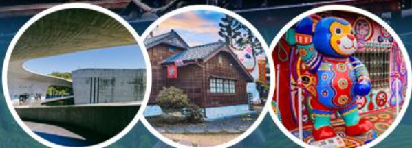
Xiangshan visitor center Hinoki Village Rainbow Village