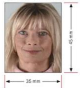
รูปถ่ายมาตรฐาน