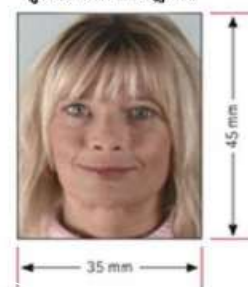
รูปถ่ายมาตรฐาน