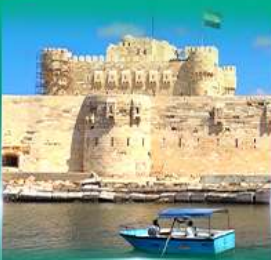
บ้อมปราสาท Quite Bay