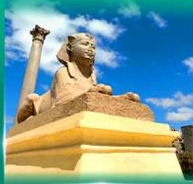
เสาสีมิงบอมเบย์