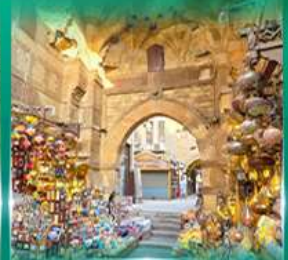
ตลาดนานเวลกาลลี