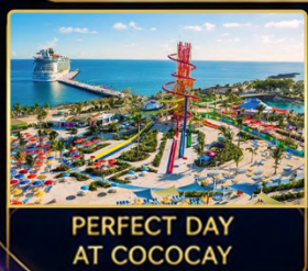
PERFECT DAY AT COCOCAY