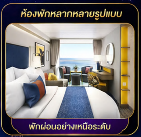
ห้องพักหลากหลายรูปแบบ

◆ สัมผัสประสบการณ์บนเรือสำราญที่ใหญ่ที่สุดในโลก