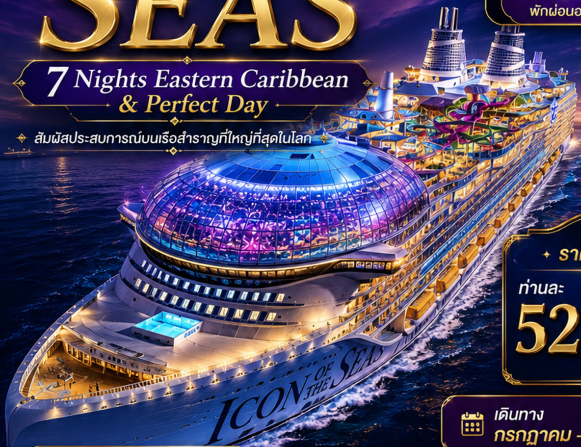
พักผ่อนอย่างเหนือระดับ