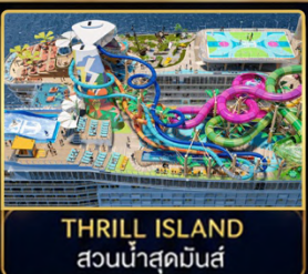
THRILL ISLAND สวนน้ำสุดมันส์