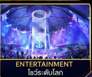
ENTERTAINMENT โชว์ระดับโลก