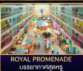
ROYAL PROMENADE บรรยากาศสุดหรู