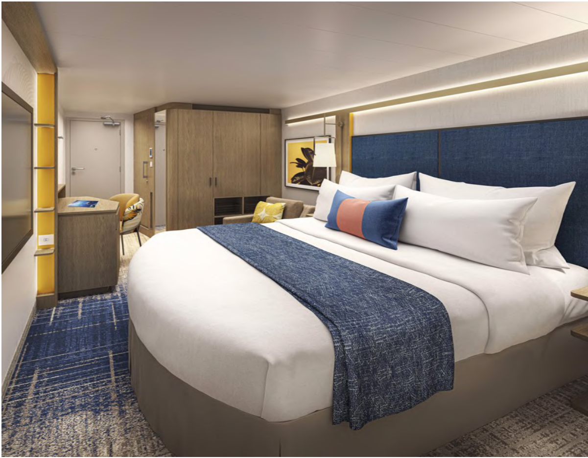
INSIDE ห้องพักแบบโมเดิร์น มีหน้าต่าง