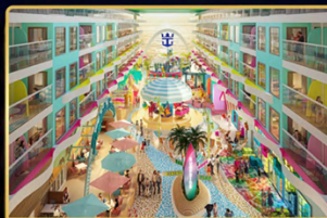
ROYAL PROMENADE แหล่งช้อปปิ้งและความบันเทิง