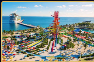
PERFECT DAY COCO CAY