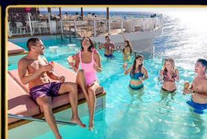
HIDEAWAY POOL สระว่ายน้ำวิวสุดชิล