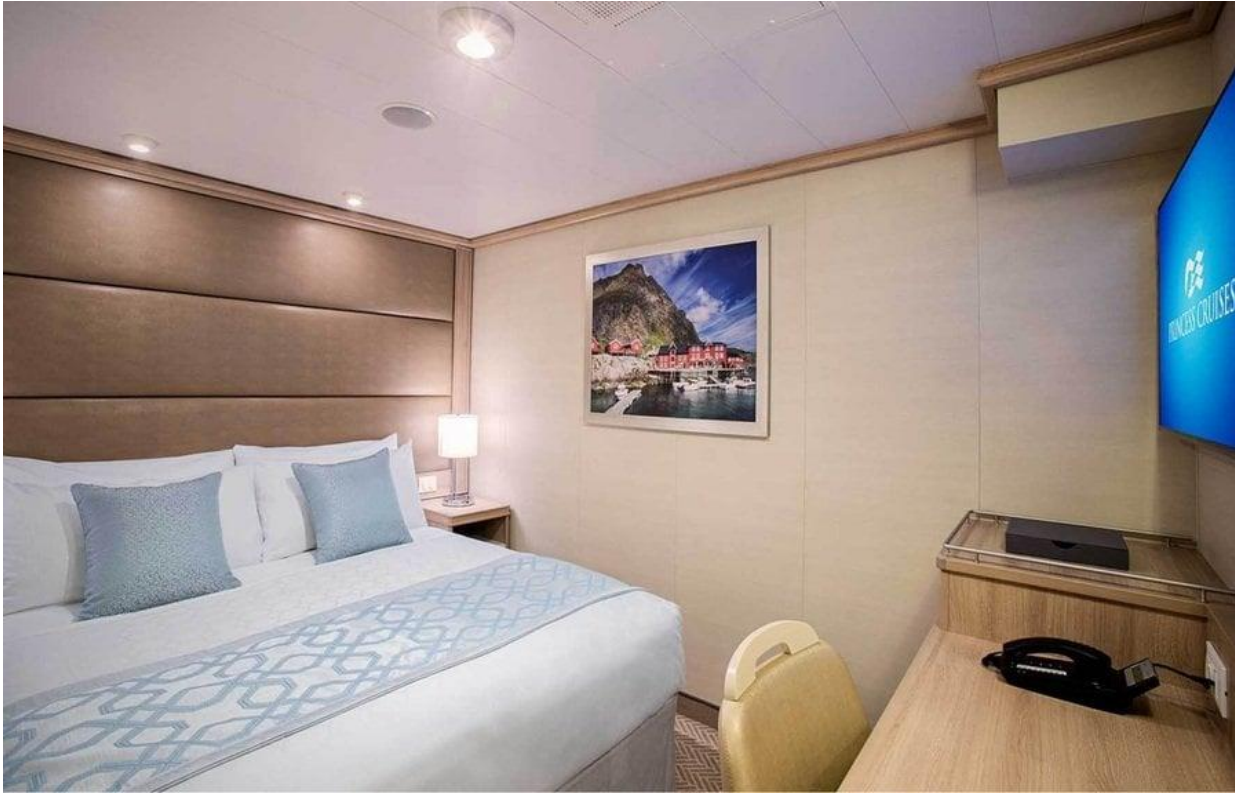
INSIDE ห้องพักแบบ ไม่มีหน้าต่าง