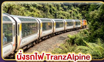
นั่งรถไฟ TranzAlpine