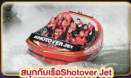
สนุกกับเรือShotover Jet