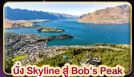
นั่ง Skyline สู่ Bob's Peak