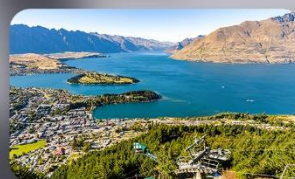
นั่ง Skyline สู๊ Bob's Peak