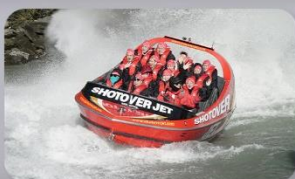
สนุกกับเรือShotover Jet