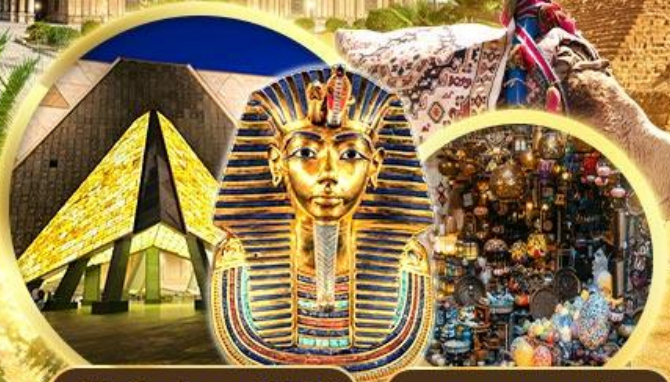
พิพิธภัณฑ์เกรนด์อียิปต์