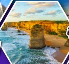
อุทยานบลูเมาส์แท่น เกรทโอเซียนโรด