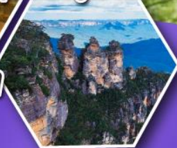
อุทยานบลูเมาส์แท่น