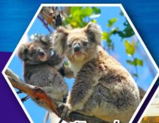
ชมหมีโคอาลา ณ สวนสัตว์ซิดนีย์