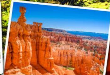
โบรซ์แคนยอน