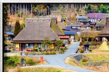
หมู่บ้านโบราณมียามะ คายาบูกิโนะซาโตะ