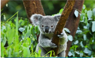
โคอาล่าปาร์ค