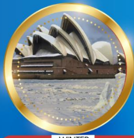
WINTER มิถุนายน-สิงหาคม 8 °C - 18 °C