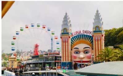
สวนสนุกภูเขา พาร์ค ซิดนีย์