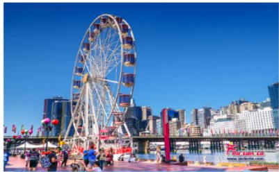
ตารี่ลิ่งฮาร์เบอร์