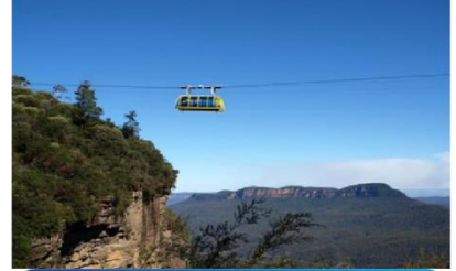
ขึ้นกระเช้าลอยฟ้า