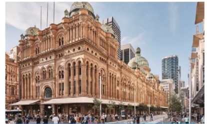
ควีนวิกตอเรียบิลдинг