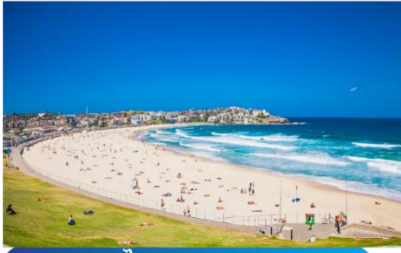
หาดบอนได