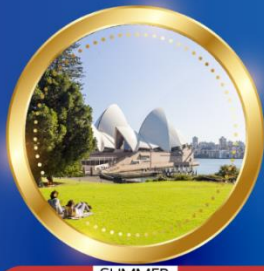
SUMMER ธันวาคม-กุมภาพันธ์ 17 °C - 26 °C