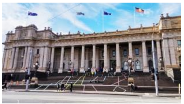
นำท่านชมด้านนอก อาคารรัฐสภาแห่งรัฐวิกตอเรีย(Victoria's Parliament House) สถานที่ทางประวัติศาสตร์การเมืองของออสเตรเลียที่มีสถาปัตยกรรมสวยงาม เป็นอาคาร

นำท่านชม เมืองเมลเบิร์น(Melbourne) เป็นเมืองใหญ่อันดับสองของออสเตรเลีย (Australia) รองจากนครซิดนีย์ และติดอันดับเมืองน่าอยู่หลายปี เนื่องจากเมลเบิร์นเป็นเมืองที่มีความหลากหลายทางวัฒนธรรม มีแหล่งช้อปปิ้ง เป็นเมืองแฟชั่น และมีสถานท่องเที่ยวมากมาย จึงไม่แปลกใจที่คนจากหลายชาติจะเดินทางมาท่องเที่ยวและอยู่อาศัยจำนวนมากทุกปี นำท่านชมด้านนอก อาคารรัฐสภาแห่งรัฐวิกตอเรีย(Victoria's Parliament House) สถานที่ทางประวัติศาสตร์การเมืองของออสเตรเลียที่มีสถาปัตยกรรมสวยงาม เป็นอาคาร