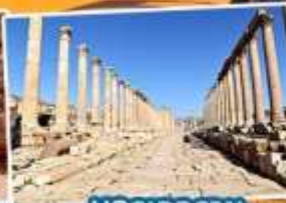
นครเจอราช