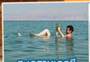
ทะเลสาบเดดซี