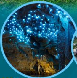
Waitomo Glowworm Caves