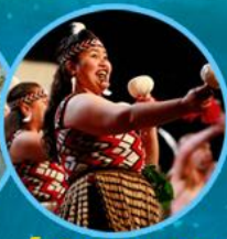
โชว์การแสดงของ ชาวพื้นเมืองมาริ