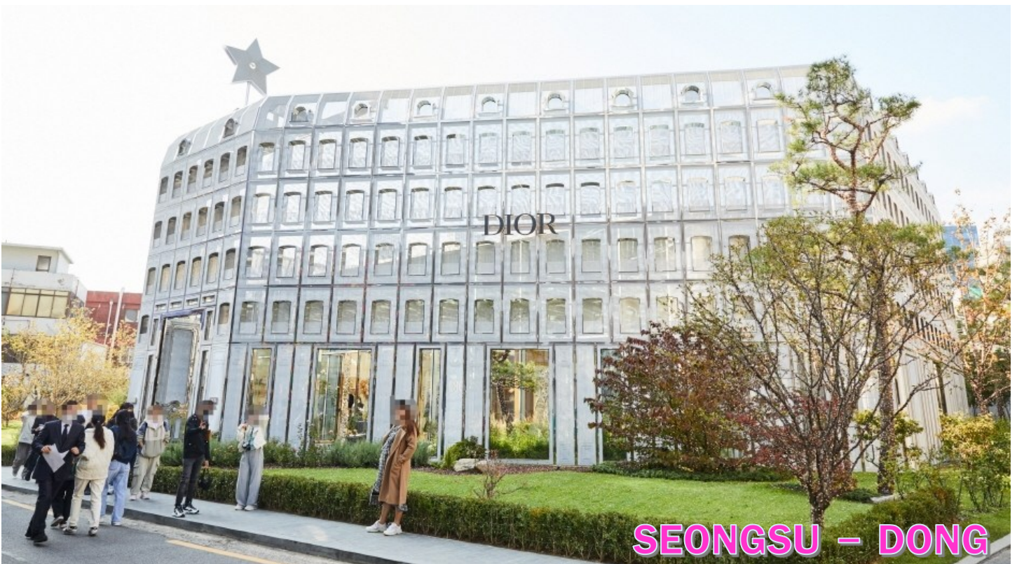
SEONGSU - DONG

รับประทานอาหารกลางวัน ณ ภัตตาคาร เมนูเทศกาลปี เมนูขึ้นชื่อจากเมือง ซุนซอน เป็นอาหารเกาหลีรสเผ็ดหวานที่โดดเด่นด้วยเนื้อไก่หมักซอสโคชูจังเข้มข้น ผสมพริกป่น กระเทียม ซีอิ๊ว และเครื่องปรุงสูตรพิเศษ หมักจนซึมเข้าเนื้อ ก่อนนำไปผัดบนกระทะร้อนพร้อมกะหล่ำปลี หอมใหญ่ มันหวาน และเส้นต็อกเหนียวนุ่ม ให้รสชาติกลมกล่อม หอมเครื่องเทศ นิยมรับประทานร้อน ๆ คู่กับข้าวสวย หรือเพิ่มซีสียัด ๆ เพื่อเพิ่มความเข้มข้นและความอร่อยยิ่งขึ้น