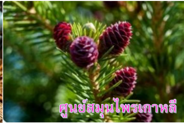
ศูนย์สมุนไพรเกาหลี

หลังจากนั้นนำท่านเดินทางสู่ย่าน เมียงดง (MYEONGDONG) ย่านช้อปปิ้งใจกลางกรุงโซลที่เต็มไปด้วยร้านค้า ห้างสรรพสินค้าชื่อดัง ร้านอาหารริมทางมากมาย โดยเมียงดงนั้นเป็นแขวงหนึ่งในเขตกรุงโซล มีพื้นที่เป็นที่ตั้งของร้านค้ากระจายตัวไปทั้งฝั่งตะวันออกและตะวันตก มีห้างสรรพสินค้าขนาดย่อม มีร้านขายสินค้าแบรนด์เนมมากมาย และยังมีสถานที่ท่องเที่ยวอันเป็นแลนด์มาร์กยอดนิยมมากมายด้วย อิสระให้ท่านได้เดินเล่นเลือกซื้อสินค้าตามอัธยาศัย