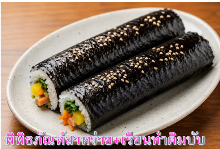
พิพิธภัณฑ์สาหร่าย+เรียนทำคิมบับ

เดินทางสู่ พิพิธภัณฑ์สาหร่าย ที่บอกเล่าเรื่องราว เกี่ยวกับสาหร่าย อาหารชั้นยอดของเกาหลี ที่ กลายเป็นส่วนหนึ่งในวัฒนธรรมการประกอบอาหารของเกาหลี เรียนการทำคิมบับ เป็นกิจกรรม วัฒนธรรมเกาหลีที่เปิดโอกาสให้ได้เรียนรู้การทำอาหารประจำชาติ ร่วมกิจกรรมใส่ชุดฮันบกหลากหลาย ที่มีไว้ให้เลือก พร้อมถ่ายรูปกับฉากและพริอบที่เตรียมไว้เก็บเป็นที่ระลึกว่าครั้งหนึ่งเราได้เคยมาเยือน ดินแดนที่มีวัฒนธรรมหลากหลายเช่นนี้