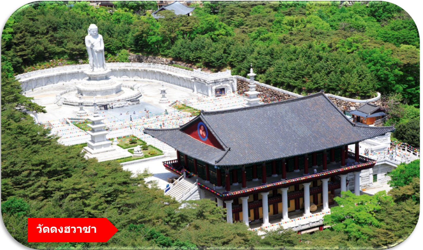
วัดดงฮวาซา