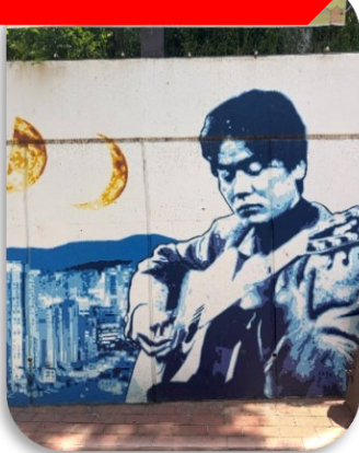
ถนนคิมควังชอก

นำท่านเที่ยวชม ถนนคิมควังชอก เป็นถนนสายเล็ก ๆ สุดอบอุ่นในเมืองแทกู ที่สร้างขึ้นเพื่อระลึกถึง คิมควังชอก นักร้องโฟล์กในตำนานของเกาหลีใต้ ผู้เกิดที่แทกูและเป็นศิลปินที่คนเกาหลียังคงรักมากจนถึงทุกวันนี้ เดิมทีบริเวณนี้เป็นกำแพงเก่าใต้ทางรถไฟ แต่ภายหลังถูกพัฒนาให้กลายเป็น "ถนนแห่งเสียงเพลงและความทรงจำ" ตลอดทางจะเต็มไปด้วยภาพวาดกราฟฟิตี้ รูปปั้นของคิมควังชอก งานศิลปะและมุมถ่ายรูปแนววินเทจ เส้นห์ของถนนนี้ไม่ใช่ความอลังการ แต่เป็นความรู้สึก "อบอุ่นและมีเรื่องราว" คาเฟ่ ร้านดนตรี และบรรยากาศย้อนยุค