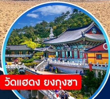
วัดแฮดง ยงกุงซา