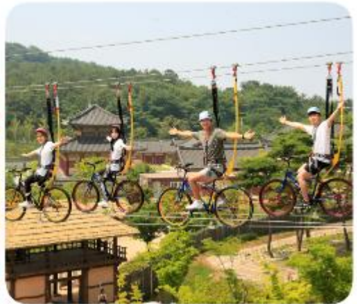
กิมแฮกายาริมปาร์ค ที่ที่ จะพาคุณย้อนเวลากลับไปสู่อาณาจักรกายา อาณาจักรโบราณของเกาหลีที่มีอายุเกือบ