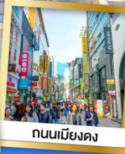
ถนนเมืองดง