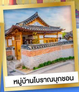
หมู่บ้านโบราณบุกซอน