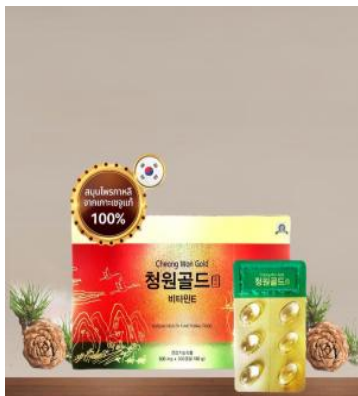
ร่างกายแข็งแรงขึ้น

เอาเงินวอนมากละลายกันอย่างเพลิดเพลิน และไม่ต้องกลัวว่าจะใส่กระเป๋าไม่พอ เพราะที่นี่พร้อมบริการบรรจุกล่อง ตามเงื่อนไขของร้านค้าด้วย