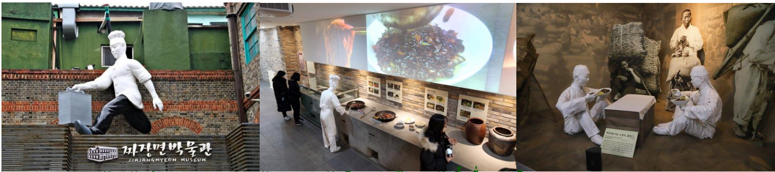
กลางวัน รับประทานอาหารกลางวัน (เมนู จางเจียงเมียนสูตรต้นตำหรับขึ้นชื่อของเมือง)

นำท่านสู่ พิพิธภัณฑ์จางเจียงเมียน (JJAJANGMYEON MUSEUM) สถานที่ท่องเที่ยวทางวัฒนธรรมของเกาหลีที่มีอายุมากกว่า 100 ปี ให้ผู้เข้าชมได้รับรู้ถึงคุณค่าทางวัฒนธรรม ประวัติศาสตร์ความเป็นมาของเมนูอาหาร “จางเจียงเมียน” เมนูยอดฮิตนี้ที่มีต่อคนเกาหลีทุกเพศทุกวัย