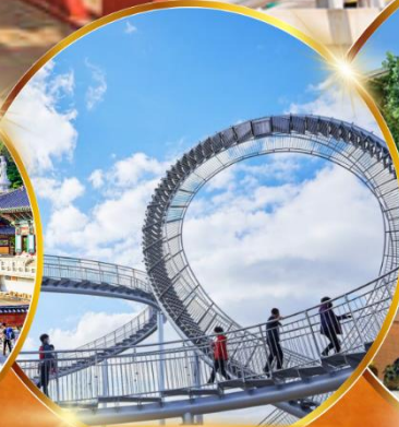
โปฮังสเปซวอล์ค