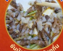
ชั้นนักชี อาหารท้องถิ่น