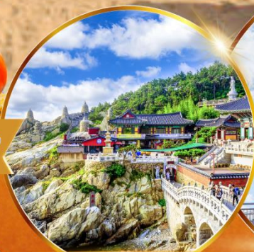
วัดแฉงยงกุงซา