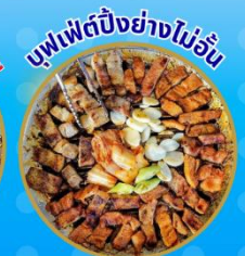
บุฟเฟ่ต์ปังย่างไม้เย็น