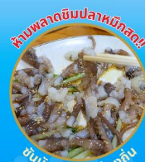
ซันนิกชิ อาหารท้องถิ่น

ถ่ายรูปชิคๆ หมู่บ้านวัฒนธรรมคิมซอน ใหม่ล่าสุด คาเฟ่ริมทะเล วิวหลักล้าน ขึ้นเคเบิลคาร์ ชมทะเลปูซาน ห้ามพลาด!! ตลาดปลาที่ใหญ่ที่สุด ซิมของจอร์รอยที่ตลาดแฮจุนแด ซุปปังตลาดพื้นเมือง แหล่งซูปปังใต้ดิน ซัมยอน อิสระซูปปัง Lotte Duty Free