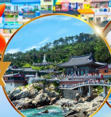
วัดแสดงยงกุงซา