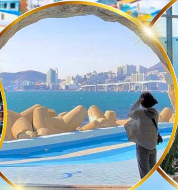
หมู่บ้านริมทะเล