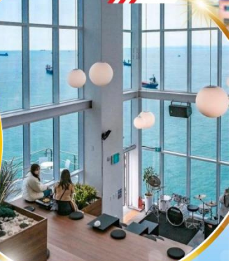
คาเฟ่ริวทะเล

ถ่ายรูปชิคๆ หมู่บ้านวัฒนธรรมคิมซอน ใหม่ล่าสุด คาเฟ่ริมทะเล วิวหลักล้าน ขึ้นเคเบิลคาร์ ชมทะเลปูซาน ห้ามพลาด!! ตลาดปลาที่ใหญ่ที่สุด ซิมของจอร์รอยที่ตลาดแฮจุนแด ซุปปังตลาดพื้นเมือง แหล่งซูปปังใต้ดิน ซัมยอน อิสระซูปปัง Lotte Duty Free