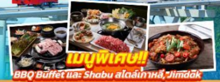
เมนูพิเศษ!! BBQ Buffet และ Shabu สizzlingเกาหลี, Jimdak

เดินทาง เมษายน - มิถุนายน สายการบิน Air Busan (BX) AIR BUSAN น้ำหนักกระเป๋า 20 KG