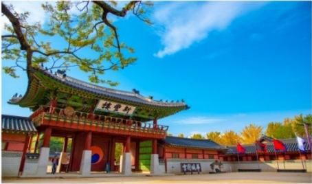
เข้าชม ป้อมปราการฮวาซอง