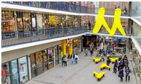
ย่านอินซาดง