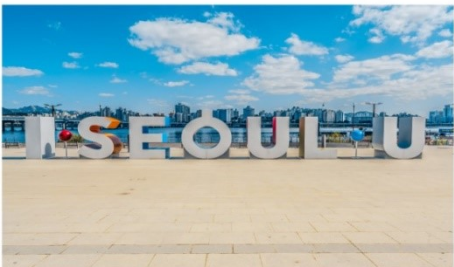
ถ่ายรูปกับป้าย I SEOUL U