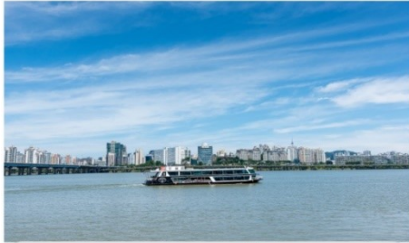
ล่องเรือสำราญแม่น้ำฮัน