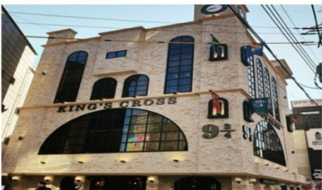
คาเฟ่แฮรี่พ็อตเตอร์