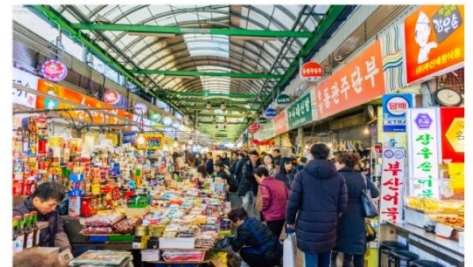
กวางจิงมาร์เก็ต