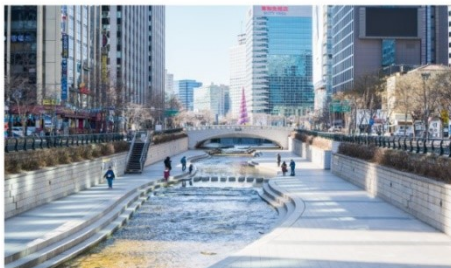
คลองชองกายซอน