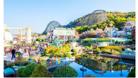
สวนสนุกเอเวอร์แลนด์