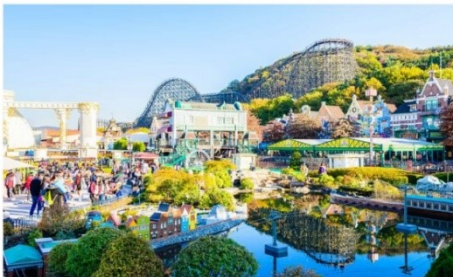
สวนสนุกเอเวอร์แลนด์