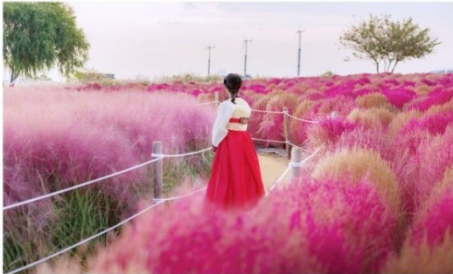
ชมทุ่งหญ้าสีชมพู