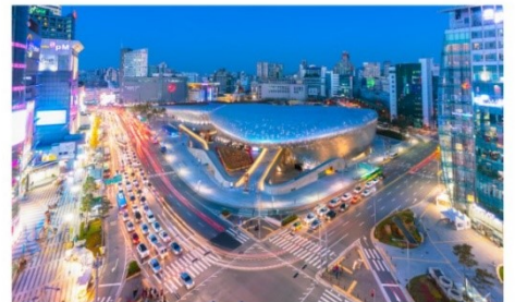
ทงแดมุน ดีไซน์ พลาซ่า