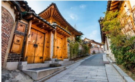
หมู่บ้านโบราณบุกซอน