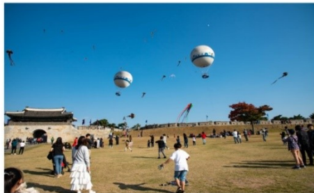
ป้อมปราการฮวาซอง