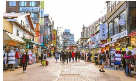
ย่านฮงแด