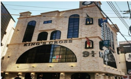
คาเฟ่แฮร์ฟอตเตอร์