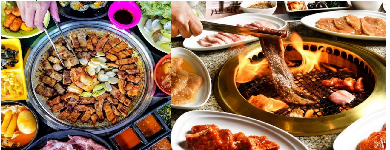
าเจี้ยว (เครื่องจิ้มหมัก ที่ช่วยชูรสอย่างดี) และเครื่องเคียงที่ชอบ

มีรสชาติออกหวาน นุ่มและกลมกล่อม เอกลักษณ์เกาหลีแท้คือการทานหมูย่าง ห่อคู่กับผักกาดเขียวแบบ เมืองคำไทย