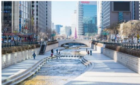
คลองชองกยซอน