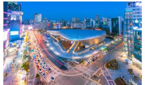
ทงแดมุน ดีไซน์ พลาซ่า