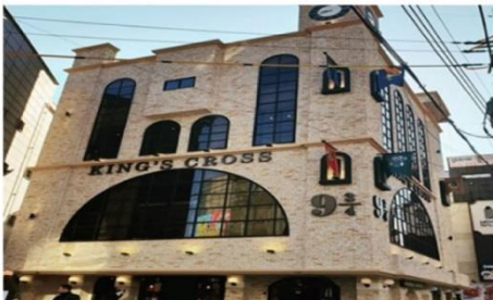
คาเฟ่แฮร์ฟอตเตอร์