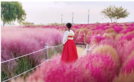
ชมทุ่งหญ้าสีชมพู