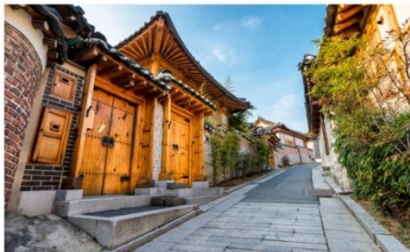
หมู่บ้านโบราณบุกซอน