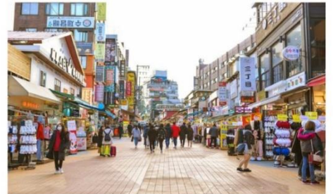
ย่านฮงแด